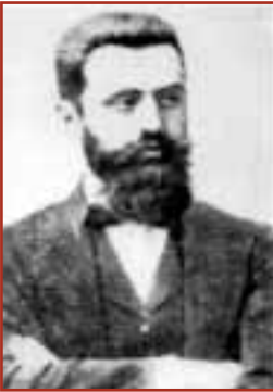
Siyonist hareketin kurucusu Theodor Herzl

Filistin'de bir Yahudi Devleti kurma hedefindeki Yahudi Miliyetçileri, diğer adıyla Siyonistler, ilk önce topladıkları paralarla Filistin'de yaşayan Araplar'dan toprak satın almaya başladılar. Ancak asıl hedeflerine bu şekilde