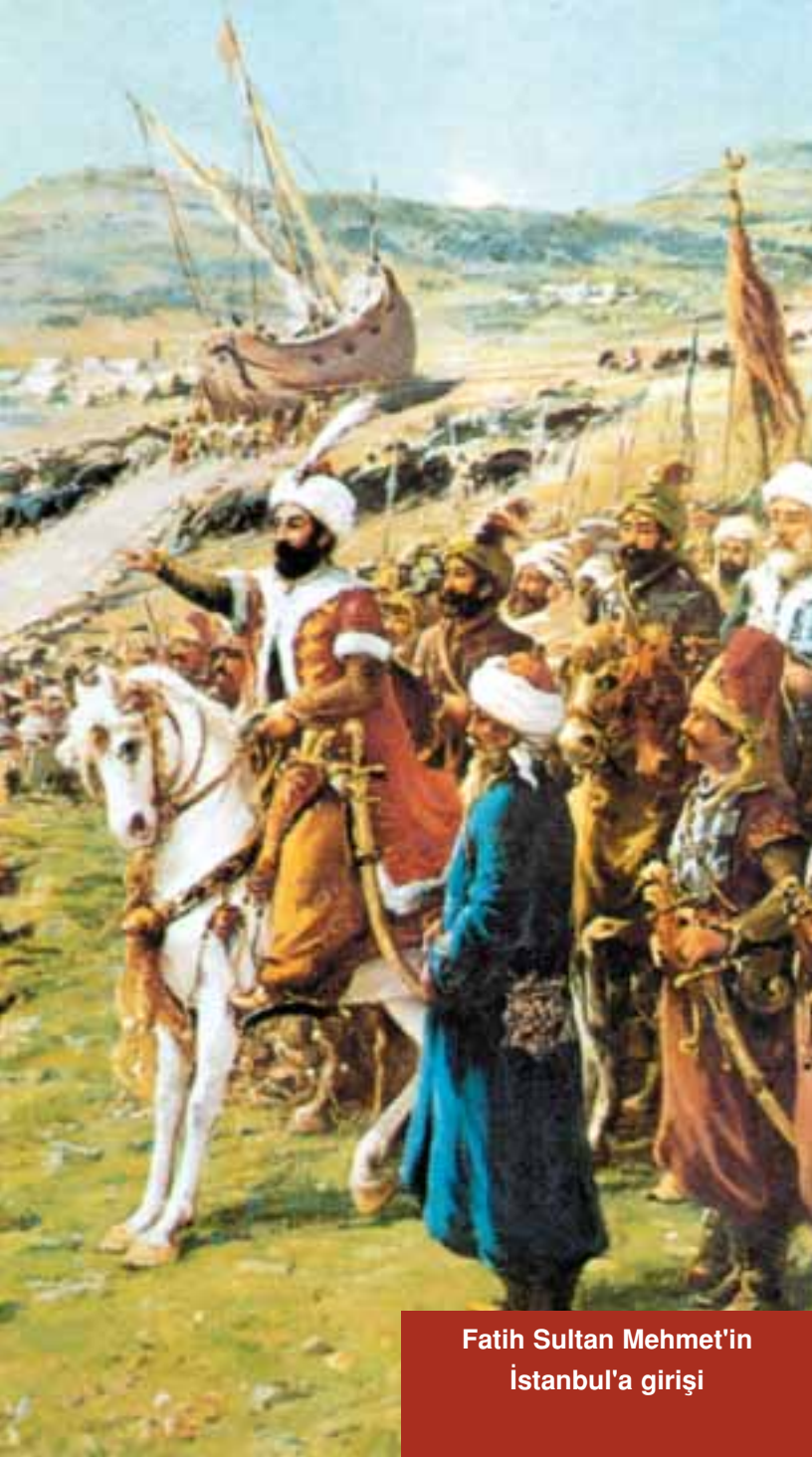
Fatih Sultan Mehmet'in İstanbul'a girişı