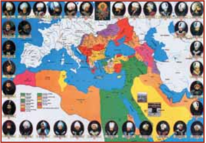
Osmanlı Devleti ve Osmanlı padişahları (1299-1922)

Şüphesiz Osmanlı'nın asırlar boyunca adalet anlayışında hiçbir sapma olmamasının en önemli nedeni bu adalet anlayışını Kuran ahlakından öğrenmiş olması ve Kuran'a olan bağlılığıdır. Kuran'da tarif edilen adalet anlayışı Müslümanları, karşı tarafa öfkeli olsalar bile, öfkelerine kapılmalarını engelleyip adil kılan bir anlayıştır. Allah bir Kuran ayetinde şöyle buyurmaktadır: