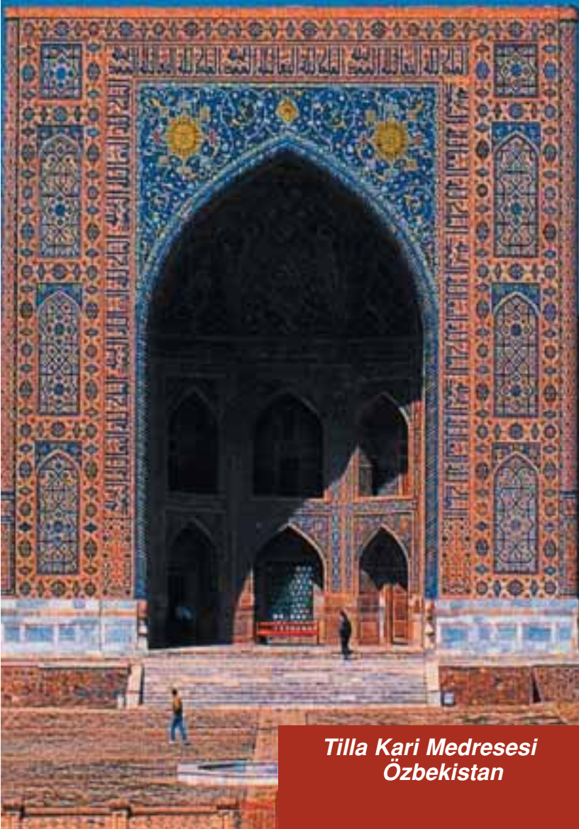
Tilla Kari Medresesi Özbekistan