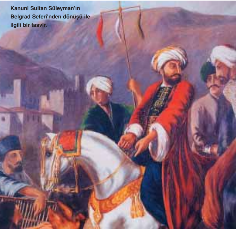
Kanuni Sultan Süleyman'ın Belgrad Seferi'nden dönüşü ile ilgili bir tasvir.

Osmanlılar ise hiçbir zaman asimile olmadılar. Aksine, fethettikleri her coğrafyaya kendi kimliklerini taşıdılar. Bunun en büyük nedeni İslam dinidir. İslam öncesi Türkler, güçlü bir kültüre sahip olmadıkları için fethettikleri topraklarda hem askeri hem de kültürel olarak kalıcı olamamışlardı.